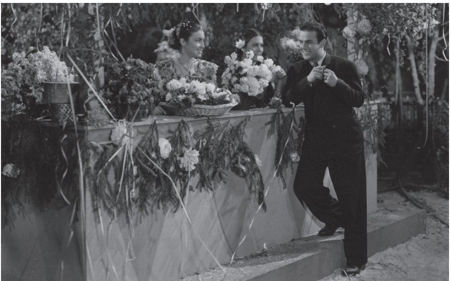
La gallina clueca (1941).