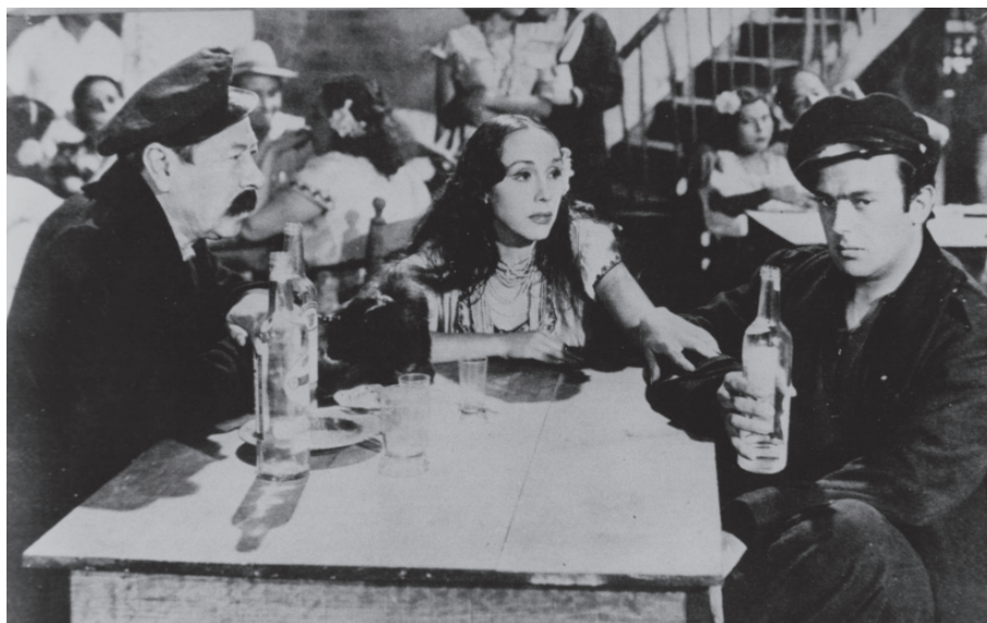
La isla de la pasión (1941), con Carlos López Chaflán e Isabela Corona.