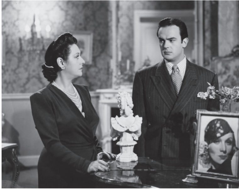
Ave sin nido (1943).